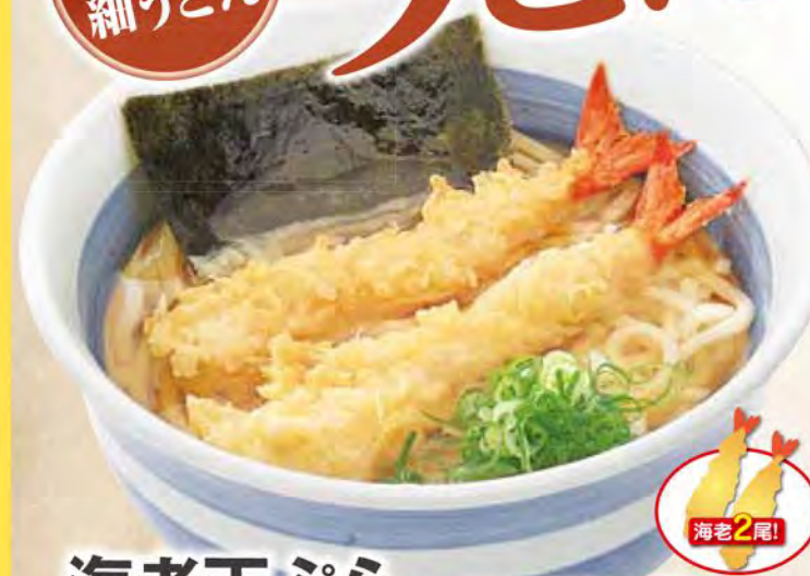
海老天ぷらうどん