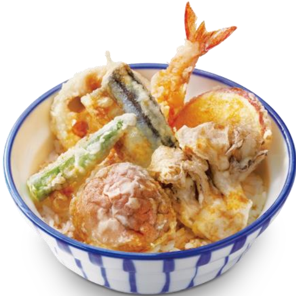
柚子香る 秋刀魚ときのこの天井 690円

天井・天ぷら本舗 さん天では、8月29日(木)から期間限定の新メニューとして『秋刀魚ときのこの天井』『秋刀魚ときのこの天ぷら定食』を全店にて販売致します。