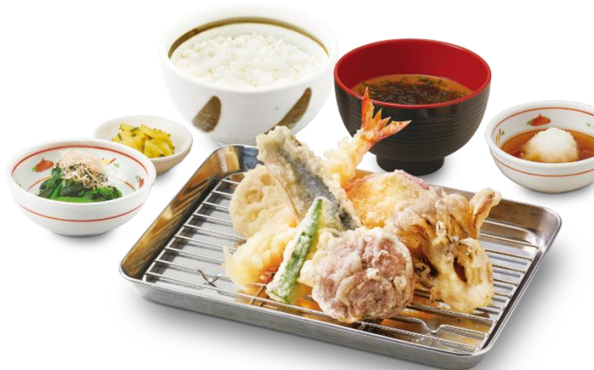
秋刀魚ときのこの天ぷら定食 880円