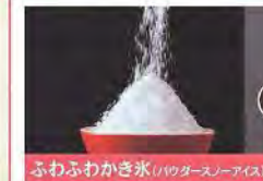
ふわふわかき氷(ワロアースアイス)