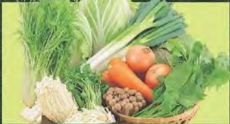
たっぷりお野菜 新鮮野菜

ビュッフェコーナーより自由にお取りください。 「揚げ物」はオーダー式でアツアツをお席までお持ちします。