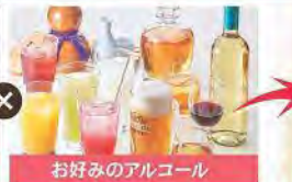
お好みのアルコール