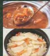
季節ごはん・カレー