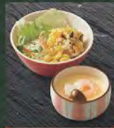
サラダ・おつまみ・茶碗蒸し