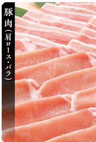
豚肉(肩ロース・バラ)