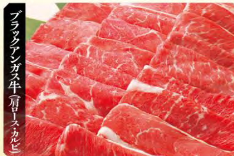
ブラックアンガス牛(肩ロース・カルビ)