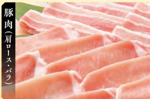
豚肉(肩ロース・バラ)