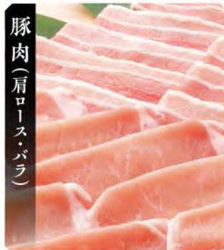
豚肉(肩ロース・バラ)