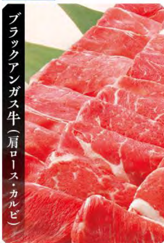
ブラックアンガス牛(肩ロース・カルビ)