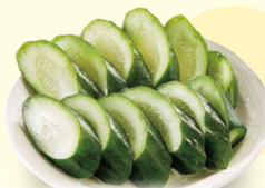
きゅうり浅漬け 390円 (ハーフ) 200円