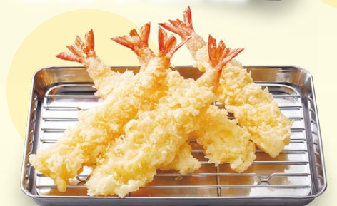
大海老づくしパック 1,150円