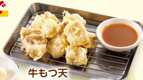
牛もつ天 590円 (ハーフ) 350円