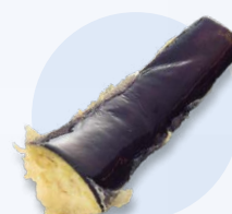
ナス天 (1切) 110円