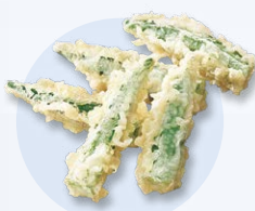
オクラ天 (1本) 80円 (5本) 150円