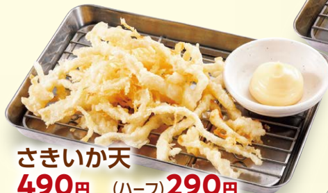
さきいか天 490円 (ハーフ) 290円