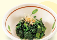
ほうれん草 おひたし 120円