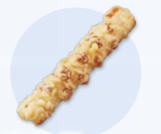
ちくわ天 (1/2本) 150円