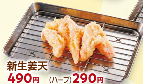
新生姜天 490円 (ハーフ) 290円