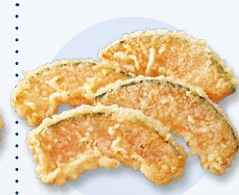
カボチャ天 (1枚) 80円 (4枚) 150円