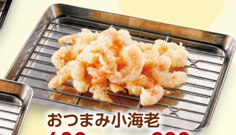
おつまみ小海老 490円 (ハーフ) 290円