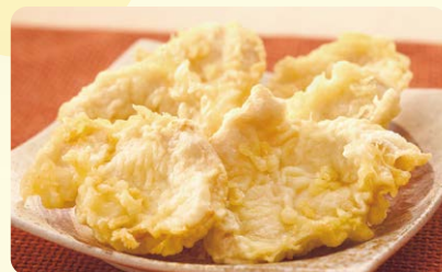
やみつき! ジューシー鶏天 (1個) 150円 (5個) 500円 (3個) 330円 (10個) 940円