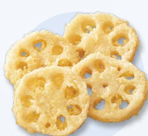
レンコン天 (1枚) 80円 (4枚) 150円